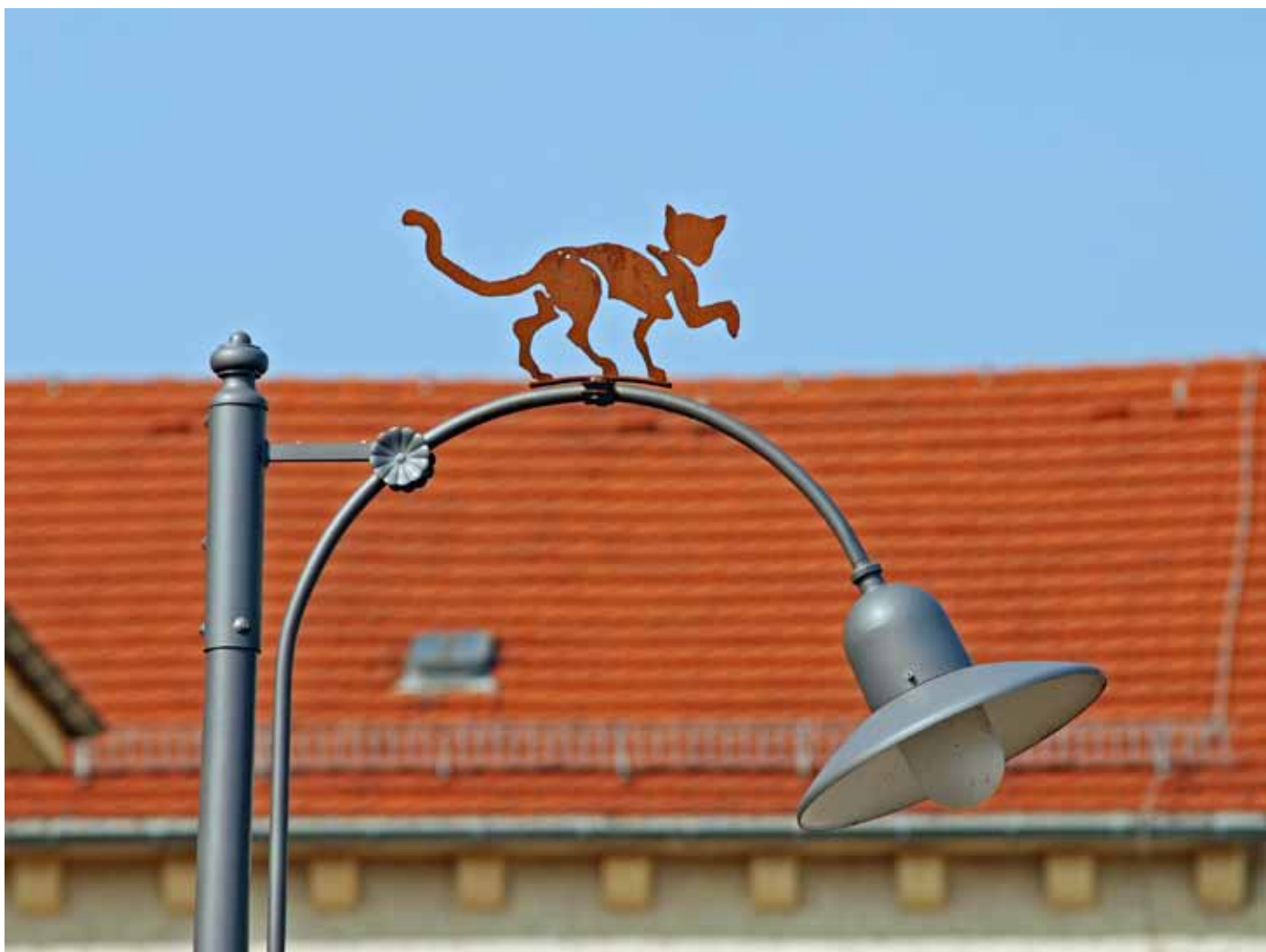
Kinderbauernhof Panama Dresden